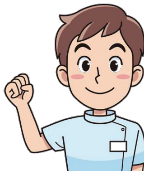
理学療法士 作業療法士